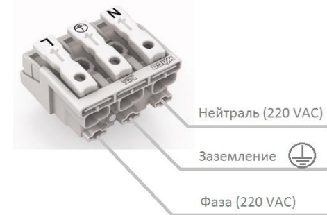
Рисунок 2 Схема подключения светильника