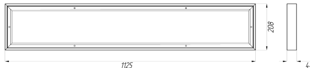
Рисунок 2. Габаритные размеры светильников ДПО02-32, ДПО02-39, ДПО02-62