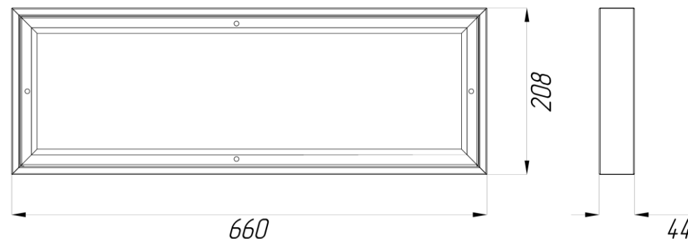
Рисунок 1. Габаритные размеры светильника ДПО02-20

1.9. Общий вид и габаритные размеры светильника показаны на рисунке 1 и 2.